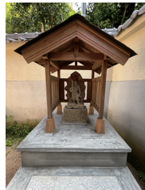
▶ 渡り廊下奥の不動明王

▶ 大師堂から御影堂への渡り廊下に、高野山奥之院を思い描いた祠を作りました。 奥之院の不動明王とはしり大黒天も安置しています。 ▲ 以前の水子地藏尊前の礼拝所を子育て地藏尊前に移設した為、新たな礼拝所を設置しました。